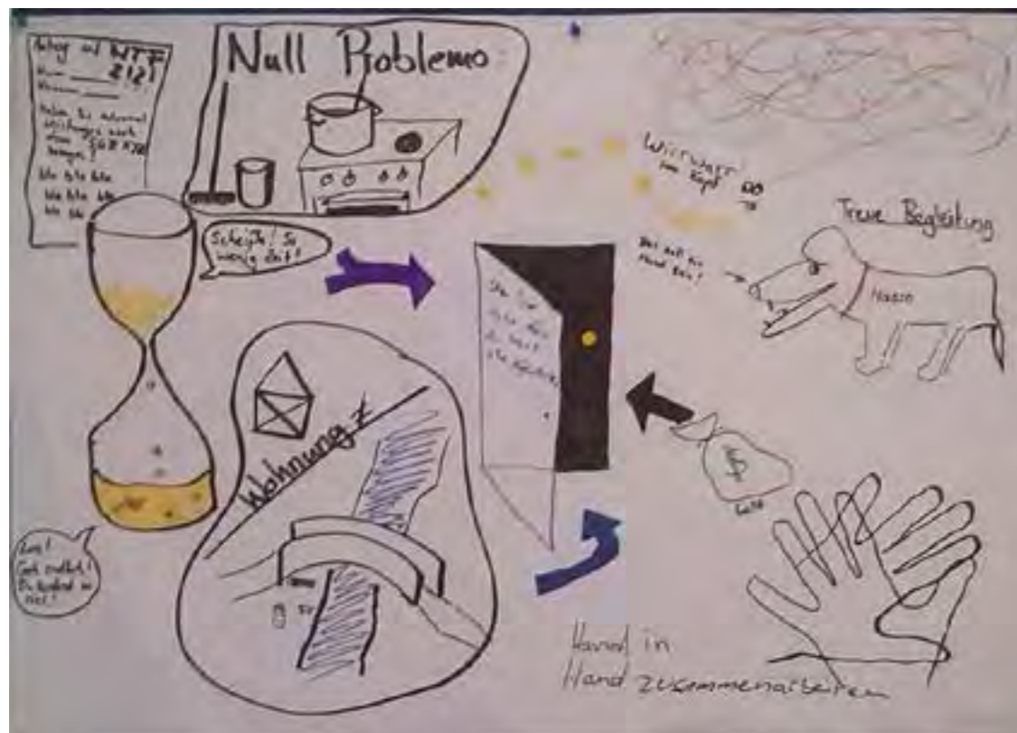
Ergebnis einer Arbeitsgruppe: Szenario der Übergangsvorbereitung

von Fachkräften oder anderen Fürsprecher_innen können Bedarfe und Ansprüche geltend gemacht werden. Das nachfolgende Bild ist das Ergebnis einer Arbeitsgruppe, die ihre Erfahrungen im Übergang grafisch eingefangen hat.